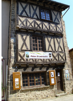
Maison du village Coriobona